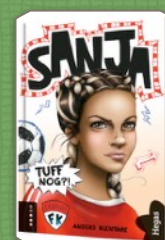
SANJA - serien

Med min bakgrund inom teatern finns även möjligheten att göra drama-övningar utifrån t.ex. elevernas egna texter.