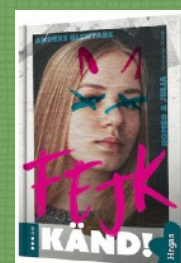
KÄND! - serien