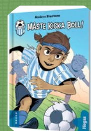
City Bols - serien